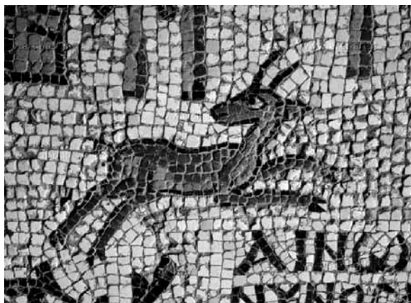
La mappa di Terra santa, mosaico del 560 d.C., Madaba (Giordania), particolare.