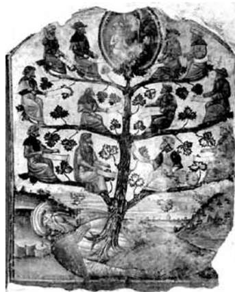
Albero di Jesse, Cattedrale di Venafro (Isernia).

Partenza per chi non fa il giro turistico.