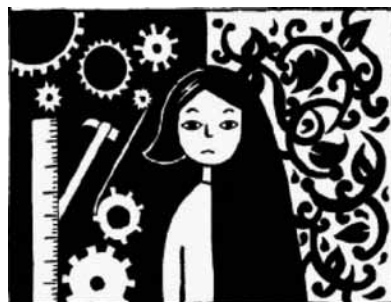
Da: Persepolis ., fumetti di Marjane Satrapi. Nuova Edizione Integrale, Rizzoli Lizard 2010 3