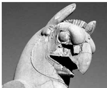
Persepolis, capitello a forma di grifone (IV sec. a.C.)

Il corso si terrà presso l'Hotel Leon d'Oro, via Roma 62, tel. 0142/76361, nel pieno centro della città, a 500 mt. dalla stazione. Inizia alle ore 15 di lunedì 2 gennaio e termina dopo il pranzo di sabato 7 gennaio. Il costo della pensione completa al giorno è di 50 euro a testa in camera doppia e di 60 euro in singola (vi sono anche alcune camere doppie con il lavandino in camera ma con il bagno in corridoio, a 40 euro a testa). La partecipazione al corso è di 120 euro per i soci di Biblia e per i giovani sotto ai 30 anni, e di 150 euro per tutti gli altri. Occorre inviare al più presto l'iscrizione con 20 euro di acconto, non rimborsabili in caso di ritiro e del costo della pensione del primo giorno.